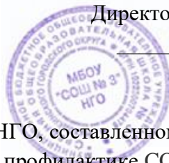
График уроков, перемен МБОУ «СОШ №3» НГО, составленному с целью минимизации контактов обучающихся при профилактике COVID-19.